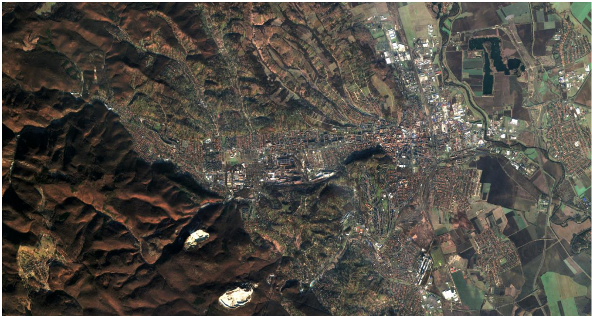
2.ábra. A Sentinel-2A felvétele Miskolcra 2015 novemberében